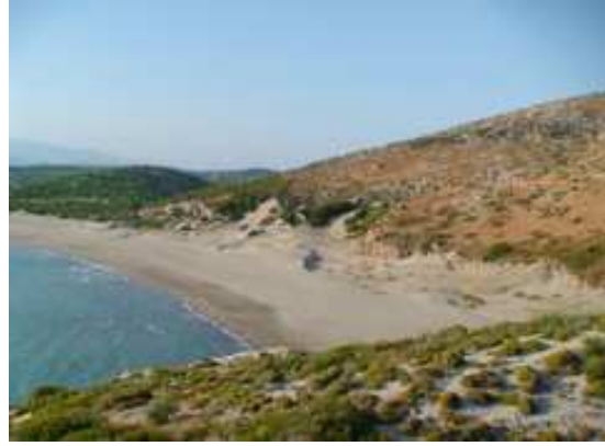
Pláže východně od Kalkanu

V sobotu ráno se přesuneme přes velké město Antalya do antického města vysoko v horách Termessos, zvaného Machu Pichu antiky. Po návratu do Antalye splují dobrodružné povahy divokou a čistou příměstskou říčku Düdense , která se vrhá do moře 50 m vysokým vodopádem. P/okusíme se zastavit ještě před ním a pokud se nám to povede, přespíme v Antalye v kempinku.