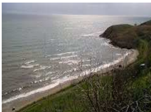
Pobřeží u Silivri

V pondělí budeme pokračovat v přesunu do jihozápadního Turecka. Večer nalezneme nocleh v okolí Pamukkale, které máme na cestě a ačkoliv (anebo protože) je to jedno z největších turistických lákadel v Turecku, v úterý je důkladně prohlédneme. V travertinových jezírkách se smí koupat a také si prohlédneme areál antického města Hieropolis.