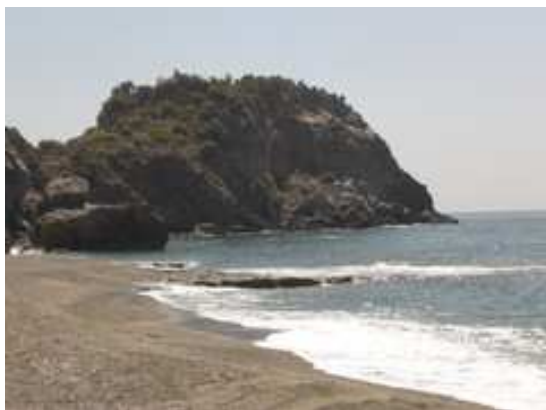
Pláže za Alany

V úterý bude odpočinkový den. Užijeme si moře a připravíme se na dlouhou cestu domů.